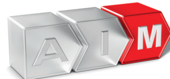
M wie Management