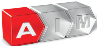
A wie Analyse

Diese beschreibt den zeitlichen und inhaltlichen Ablauf unserer Leistungen zur Durchführung von e-CONCEPT in Ihrem Unternehmen: